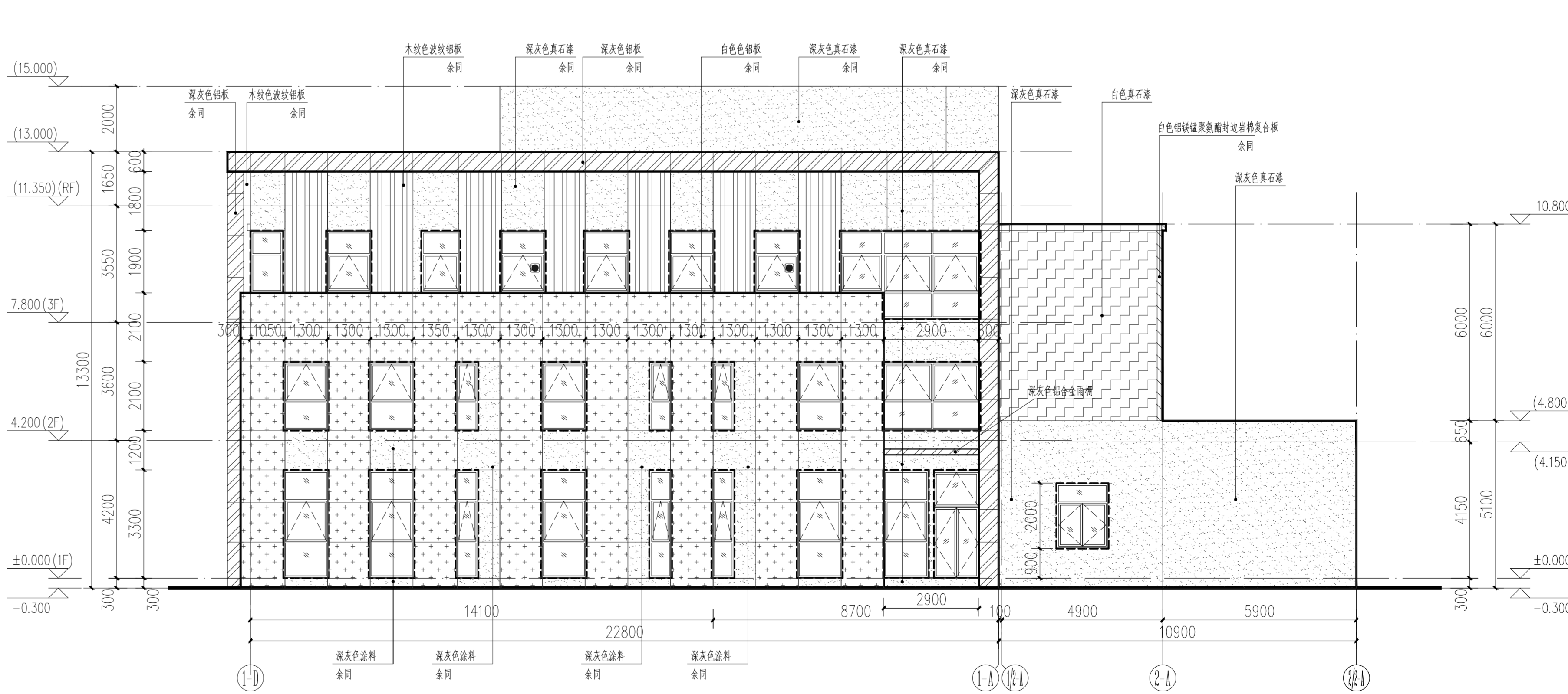
办公楼(1-A)~(1-B) 轴立面图 1:100 丁类车间(2-A)~(2-B) 轴立面图 1:100